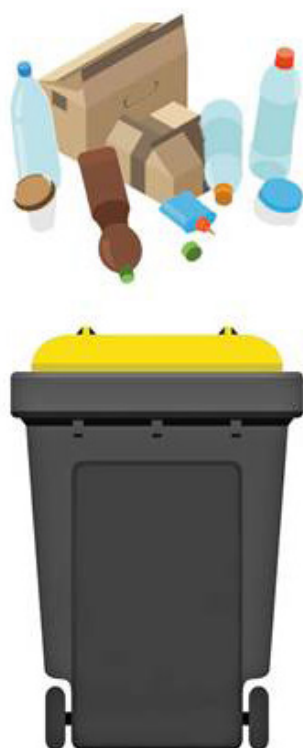
Emballages et papiers