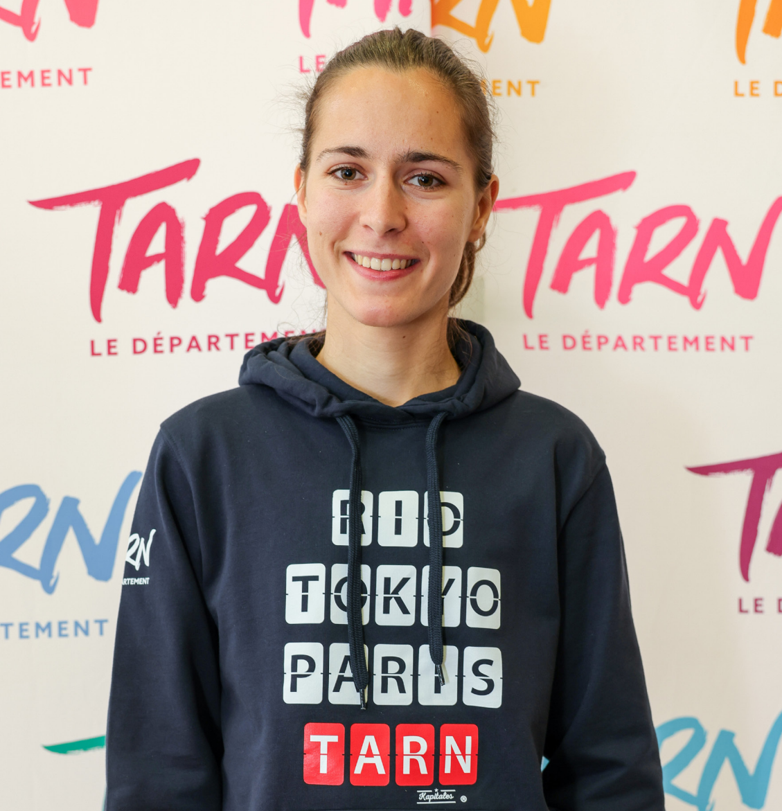
Méloody Julien - © Département du Tarn