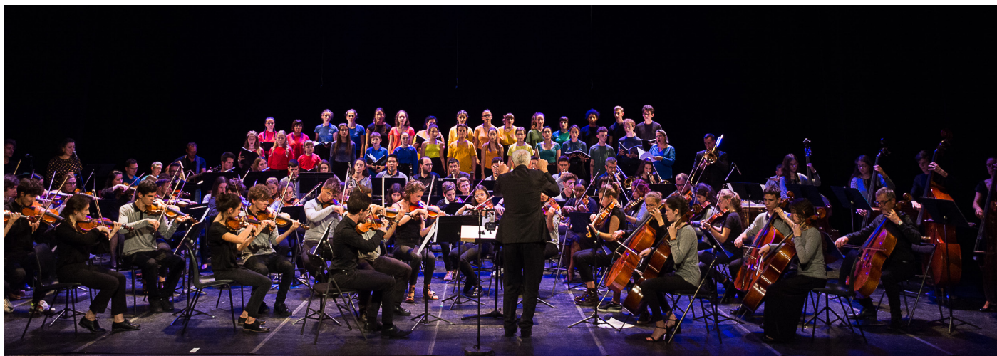
Conservatoire départemental de Musique et de Danse du Tarn - © Département du Tarn