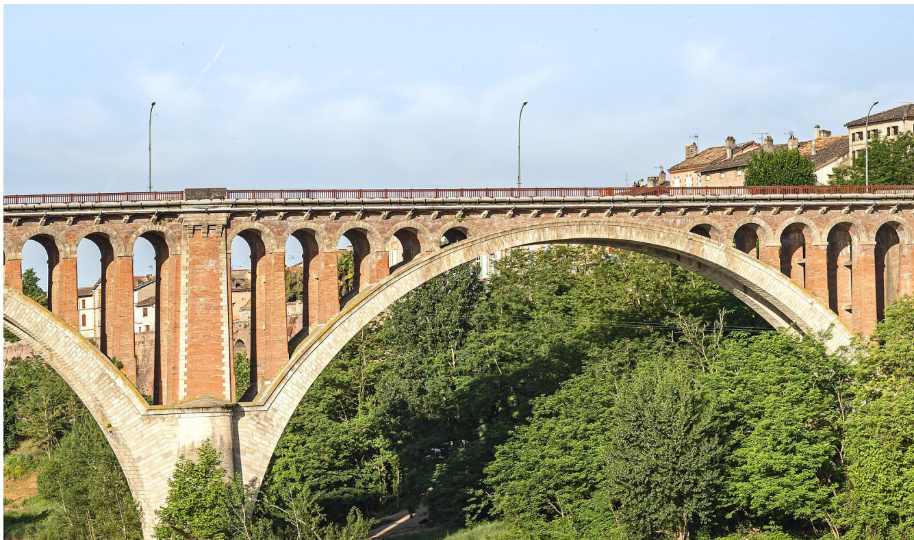
Pont de Rabastens